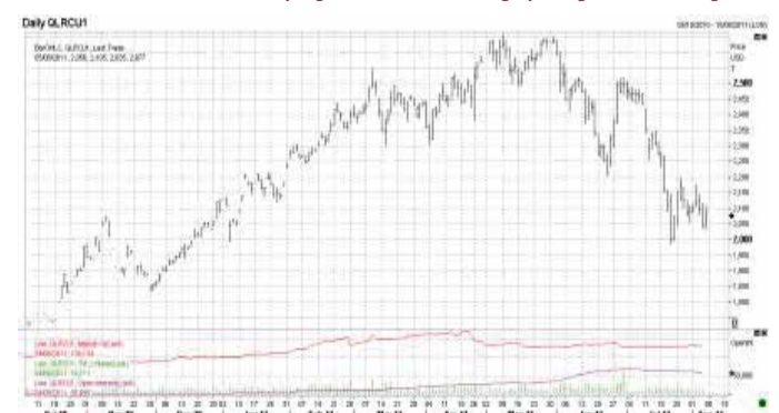
Динаміка цін на каву робусту в Лондоні (вересень 2011 р.)