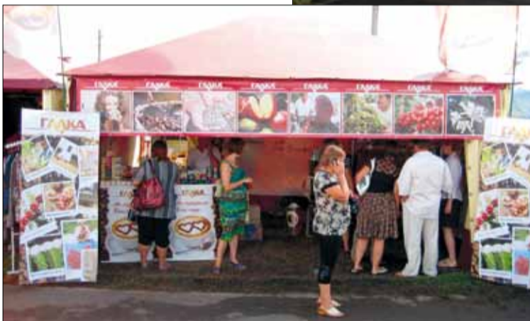
Найгарніший намет на Сорочинцях