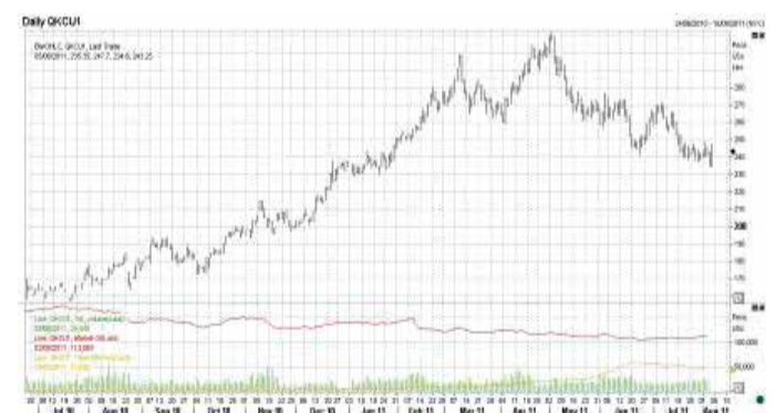
Динаміка цін на каву арабіки в Нью-Йорку (вересень 2011 р.)