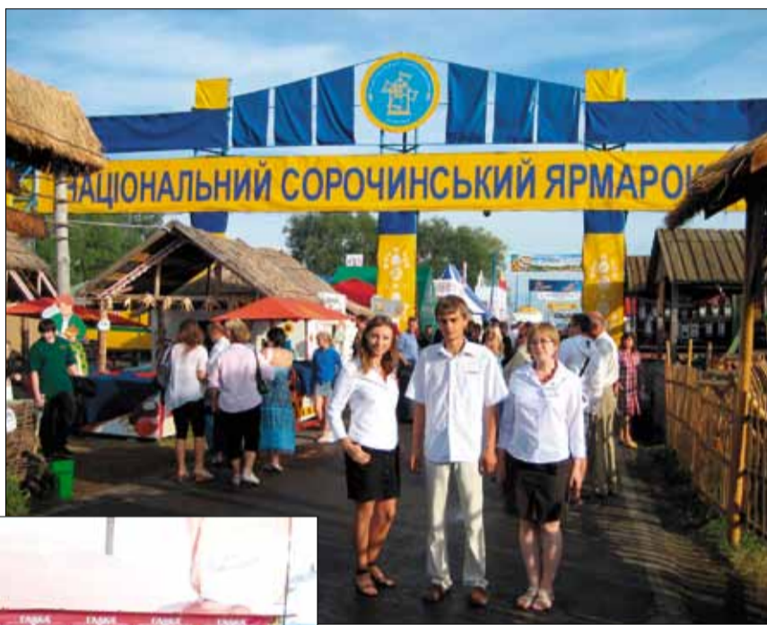
Центральний вхід на Ярмарок. Делегація від СП "Галка Лтд"

ському ярмарку, окрім Диплома учасника, цьогоріч отримала Грамоту за перемогу у номінації "За високоякісну смачну продукцію" Національного Сорочинського ярмарку-2011.